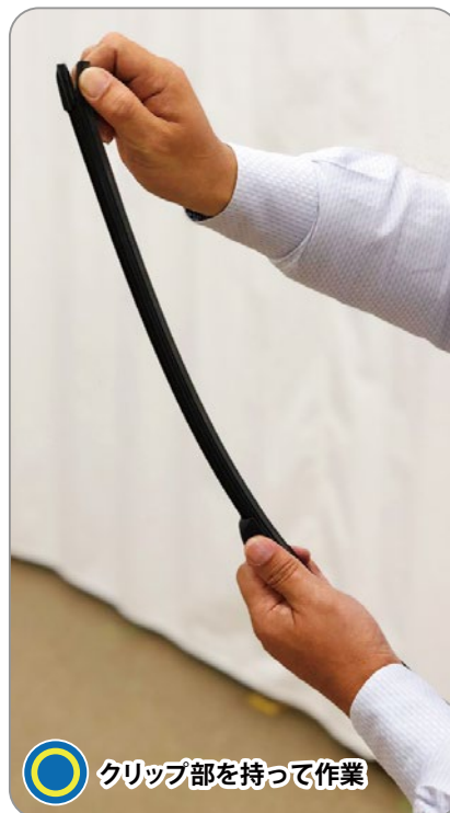
クリップ部を持って作業

※ワイパーラバー交換時にワイパーを強く握ったり、曲げたりして強い力が加わるとワイパーが変形し払拭に影響が出る恐れがありますので、必ずクリップ部を持って交換してください。